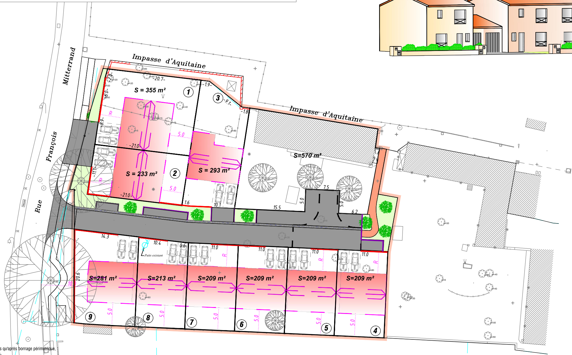
LEGENDE PLAN DE MASSE